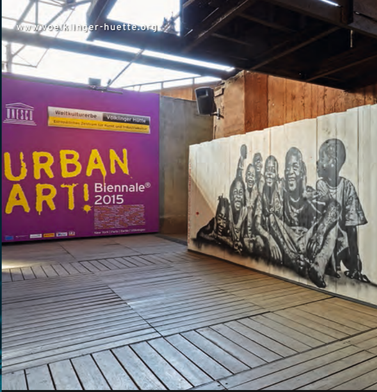
Jef Aérosol, Black is beautiful!, 2014

UrbanArt Biennale® 2015 bis 15. November 2015