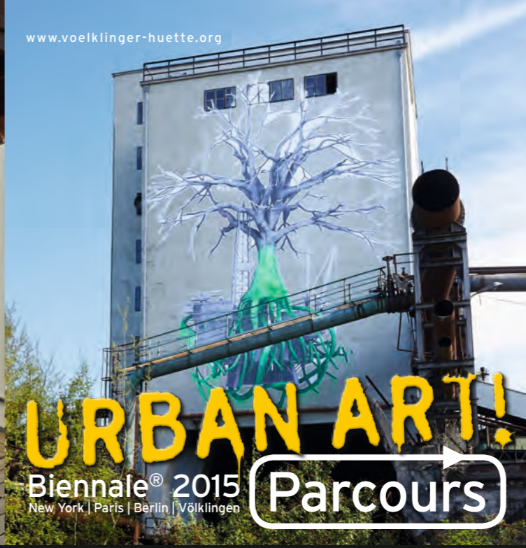
Ludo, Tree of Life, Höhe 30 m, 2015