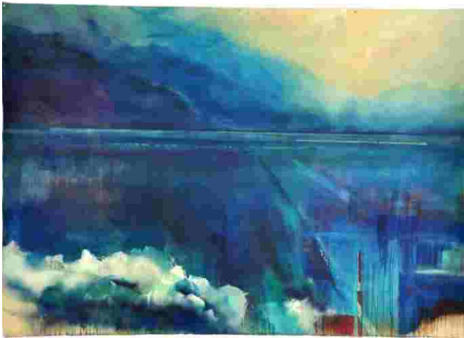
PD_11_08, 2008 Acryl, Tusche, Lack auf Baumwollsegeltuch 210 x 298 cm

„Malerei ist Farbe, sie selbst stellt für mich den Bildinhalt dar, und ich möchte in Farbe eintauchen und dem Betrachter eben diese Erfahrung ermöglichen.“