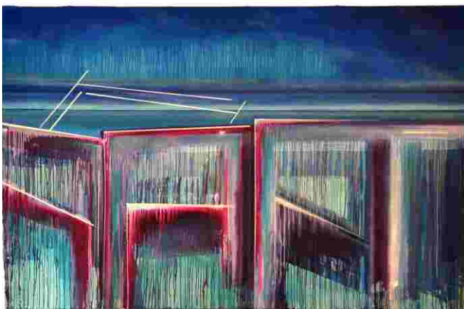
G_4_10, 2010 Acryl, Tusche, Lack auf Baumwollsegeltuch 210 x 327 cm Titelbild: F_02_10, 2010 Acryl, Tusche, Lack auf Baumwollsegeltuch 210 x 293 cm

„Malerei ist Farbe, sie selbst stellt für mich den Bildinhalt dar, und ich möchte in Farbe eintauchen und dem Betrachter eben diese Erfahrung ermöglichen.“