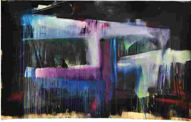
R_1_09, 2009 Acryl, Tusche, Lack auf Baumwollsegeltuch 210 x 350 cm